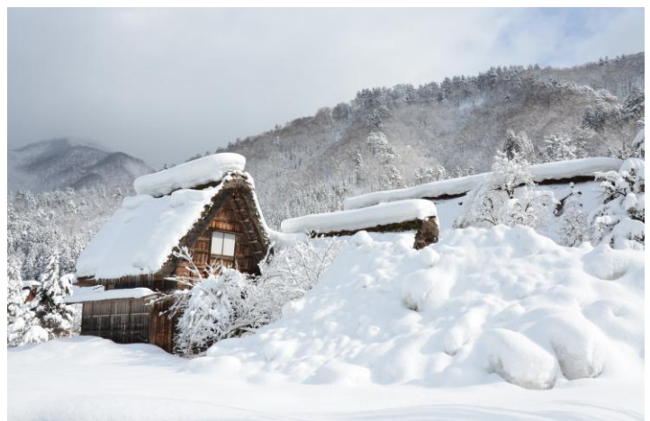
▲ 世界遺産 合掌造り集落

長野とは、何と遠く雪の多い所か・・・雪雪雪あまりの雪の多さに驚きながら丸一日雪の舞う中をスノーシュー夏とは全く違う上高地を満喫。2日目はこれまた豪雪の白川郷雪を楽しみました♪